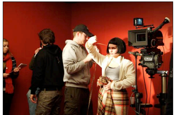
Behind the scenes - Studio Ålgård - Audition, regi Marius Soma