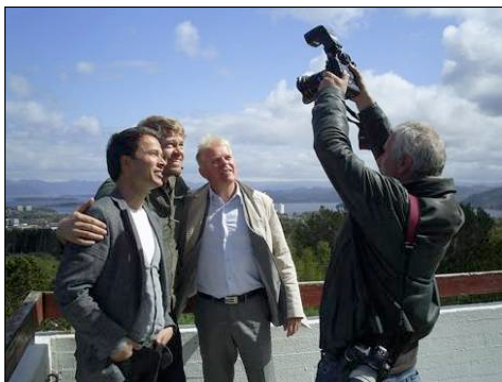
Filmkraft mottok nylig 1,6 millioner kroner i investeringstøtte fra SR-Bank.