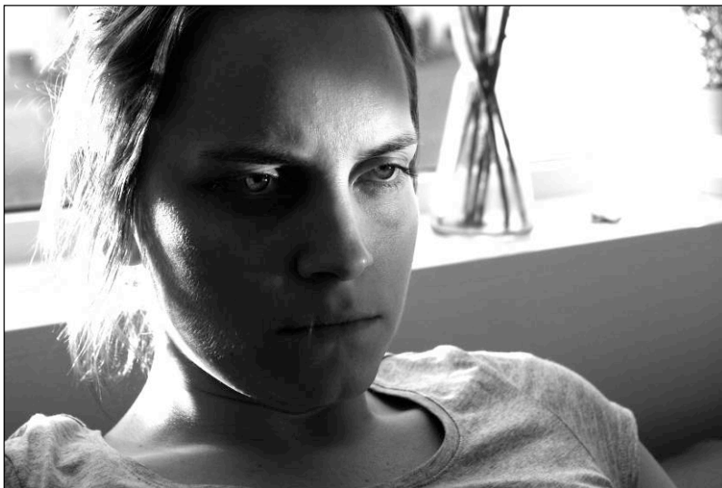
Du skal få en dag i morgen, regi Pål Jackmann

Eiere av Filmkraft Rogaland AS er Rogaland Fylkeskommune, Stavanger Kommune, Haugesund Kommune og Randaberg Kommune. Det arbeides kontinuerlig med å utvide eierskapet i selskapet til å omfatte flere kommuner i Rogaland. I 2006 mottok Filmkraft Rogaland AS 4,2 millioner kroner i tilskudd fra eierne.