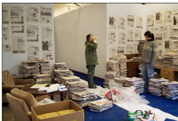
Behind the scenes - Spandexmann