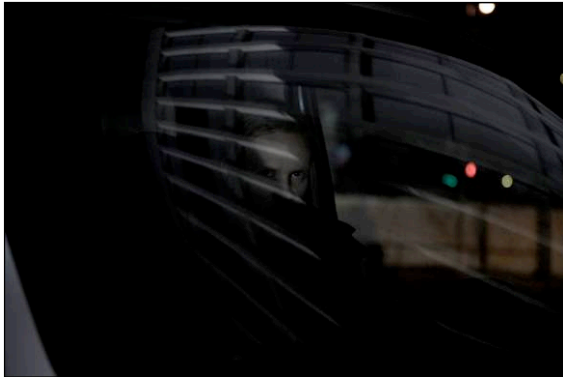
Down under , regi Bobbie Peers - 5 grøss