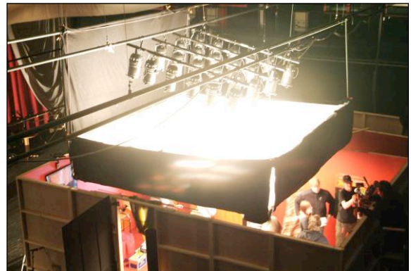
Behind the scenes - studio Ålgård - Audition, regi Marius Soma